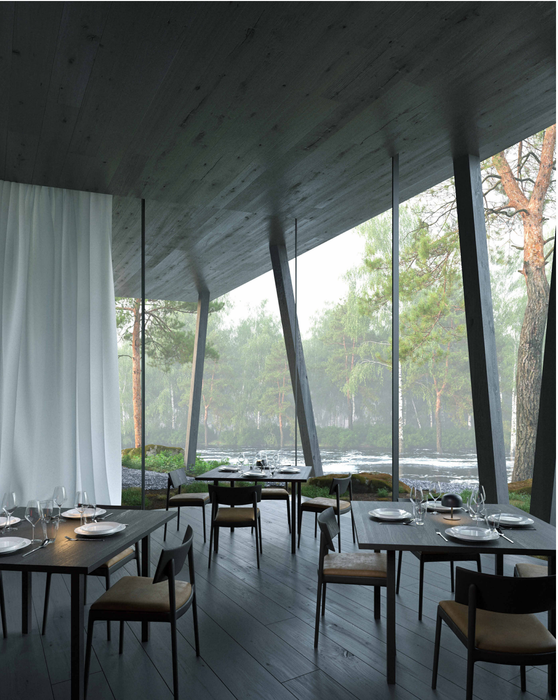
REFERANSEBILDE "LIGHT STACKING CHAIR" - TIME & STYLE

NB. FLERE BORD MÅ TIL VED FOR EKSEMPEL OPPSTILLING I "HESTESKO" FOR EVENT I HELE LOKALET